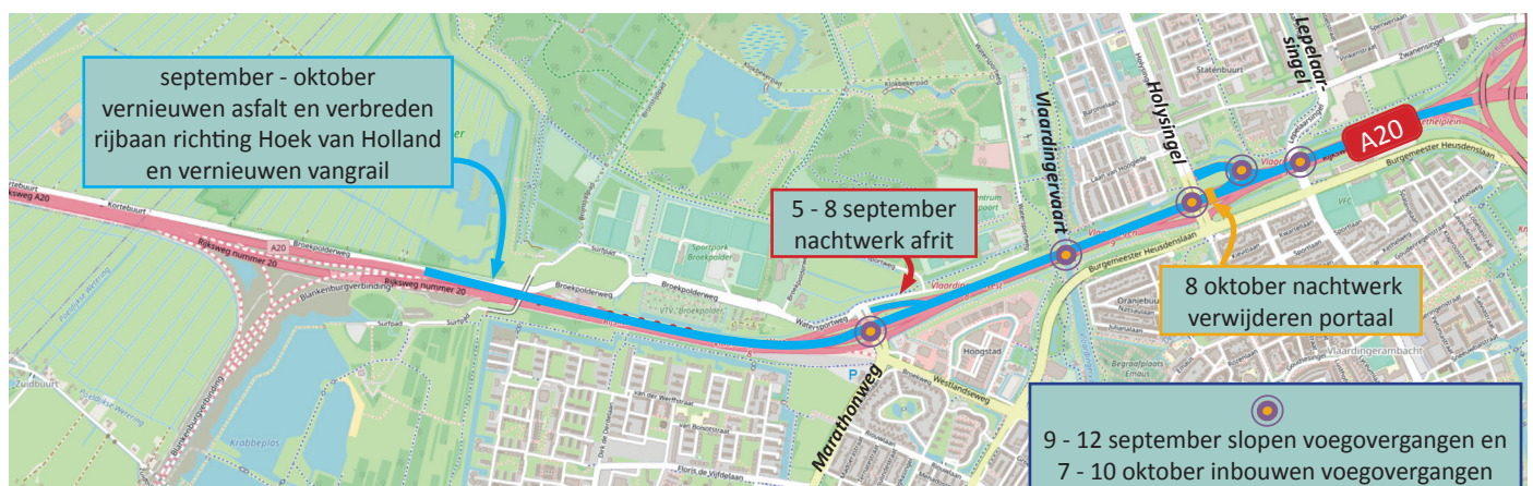
Afbeelding 1 Werklocaties A20 tussen Maassluis en Kethelplein september en oktober 2022

In oktober, november en december voeren we vrijwel dezelfde werkzaamheden uit op de rijbaan richting Rotterdam. Hierover ontvangt u half oktober een bouwbericht.